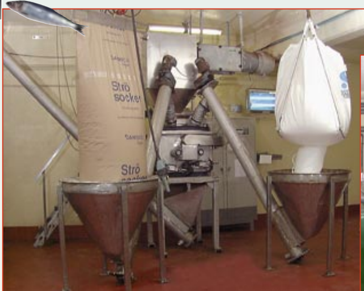
I såsköket produceras olika kryddblandningar, ättiksmarinad och saltlake. Blandningarna transporteras i rörsystem till stationen där sillen läggs i tunnorna.