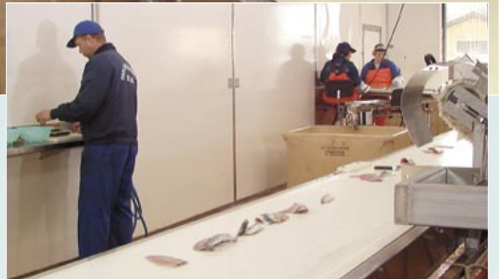
Sillen filéas i filémaskinerna. Personalen övervakar, gör kvalitetskontroll och avsynar.