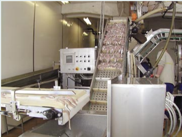
Efter avsyning vägs sillen automatiskt. Det mesta går vidare för marinering, kryddning eller saltning i tunnor och en del levereras som färskvara.