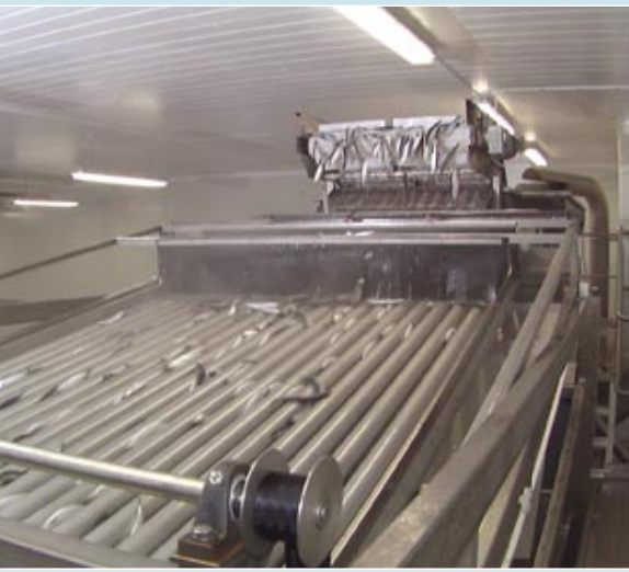
Försortering. Därefter finsorteras sillen och förs med band till filémaskinerna